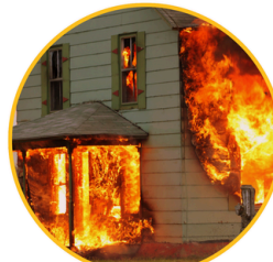
BONO POR SINIESTRO