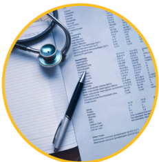
REEMBOLSO GASTOS MÉDICOS

Te invitamos a ingresar a nuestra página web para interiorizarte en profundidad.