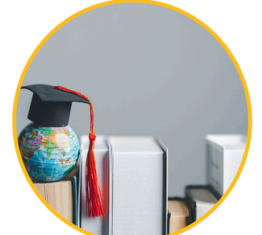
BONO CONTINUIDAD DE ESTUDIOS