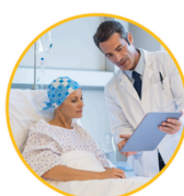
BONO ENFERMEDAD CATASTRÓFICA