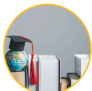
BONO CONTINUIDAD DE ESTUDIOS