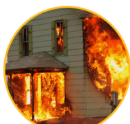
BONO POR SINIESTRO