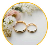
BODAS DE ORO